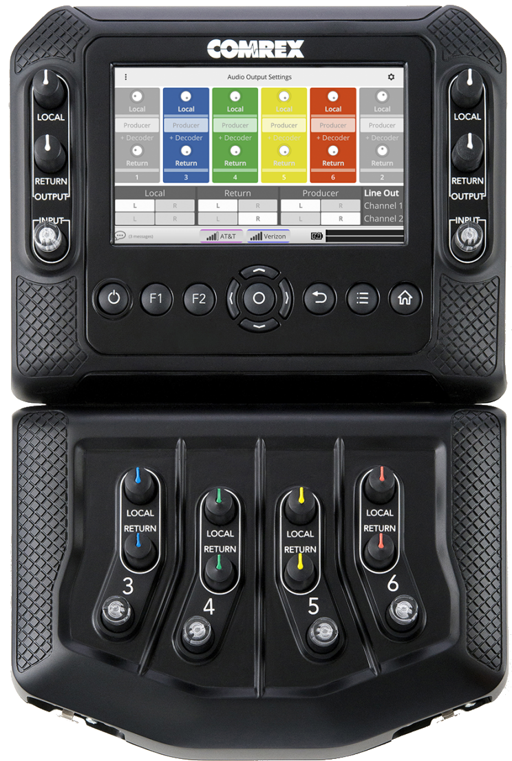
ACCESS NX Portable - Opcional Mixer de cuatro canales